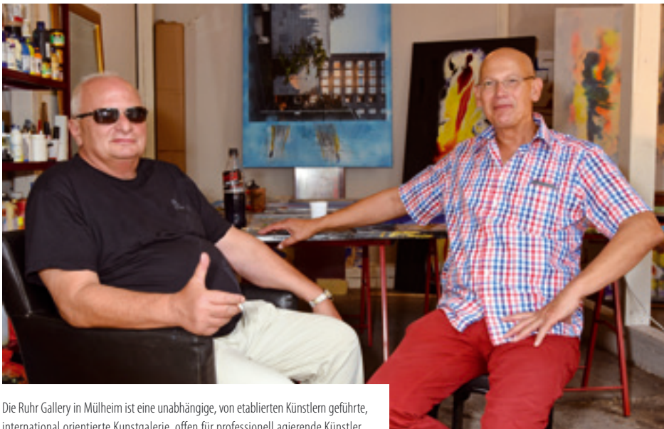
Die Ruhr Gallery in Mülheim ist eine unabhängige, von etablierten Künstlern geführte, international orientierte Kunstgalerie, offen für professionell agierende Künstler