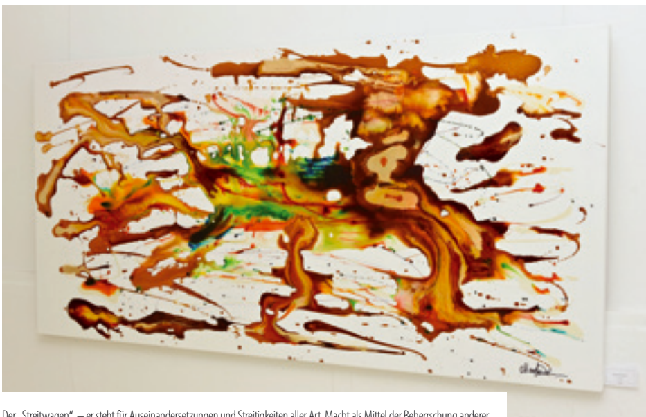
Der „Streitwagen“ – er steht für Auseinandersetzungen und Streitigkeiten aller Art, Macht als Mittel der Beherrschung anderer